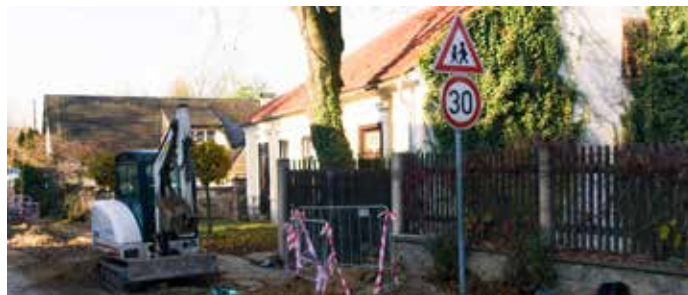
Stavba vodovodu a kanalizace v Dehtárech (listopad 2016)