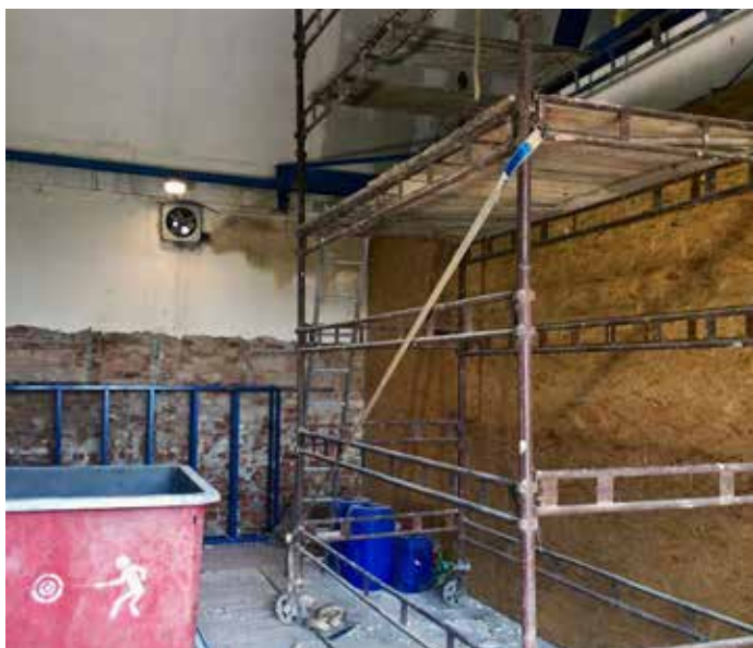
Rekonstrukce hasičské zbrojnice