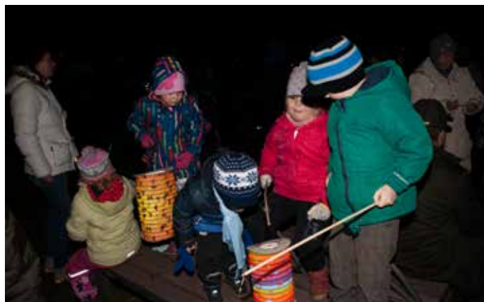
Lampionový průvod 17. listopadu (listopad 2016)