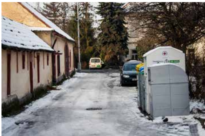
Místo pro sběr tříděného odpadu v ulici Radonická (J. Hulík / leden 2016)