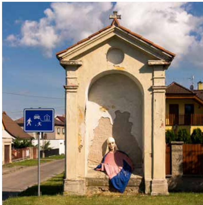
Sečenská kaple (J. Hulík / červen 2015)

Celkem pět dochovaných kaplí se nachází na území Vnoře. V poli mezi Kbely a Vnoří, kde dnes vzniká golfové hřiště, stojí dvě kaple, již 23. a 24. z původního pořadí. Kaplička dvacátá třetí, Nezamslycká, vystavěná péčí Františka říšského