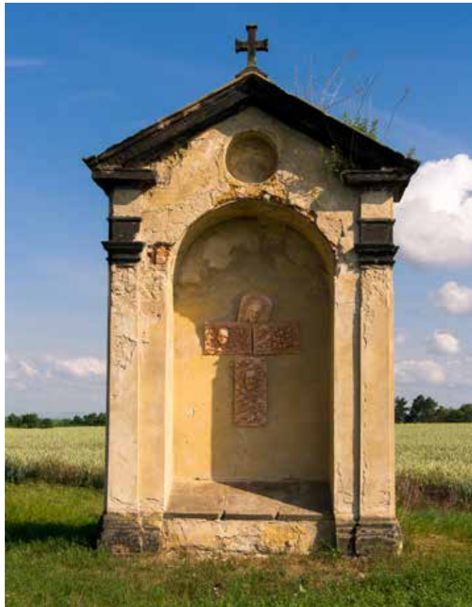
Rokycanská kaple

Svatá cesta s kaplemi navazuje na tradici svatováclavských poutí z Prahy do Staré Boleslavi