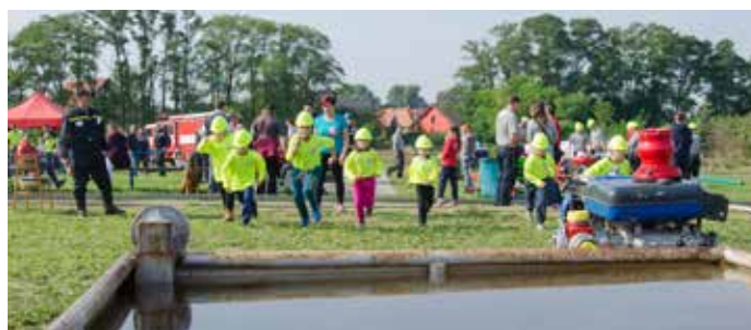
Hasičská soutěž Dřísy (J. Musílek / září 2016)