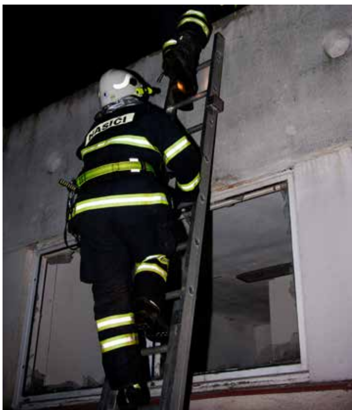
Noční soutěž v Dolínku (J. Hulík / říjen 2016)