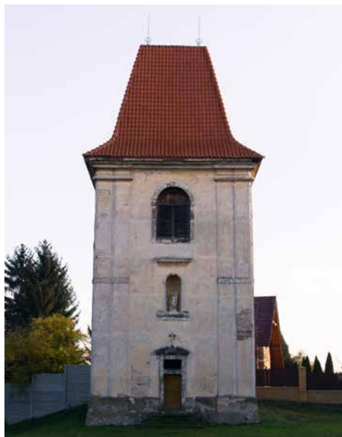
Zvonice v Dřevčicích (J. Hulík / listopad 2016)