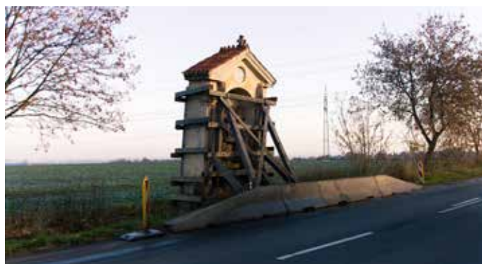
Strašenská kaple (J. Hulík / listopad 2016)