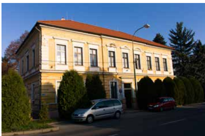
Škola v Dřevčicích (listopad 2016)

Starosta: Eva Šafarčíková Web: www.drevcice.cz