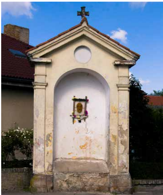
Šternberská kaple