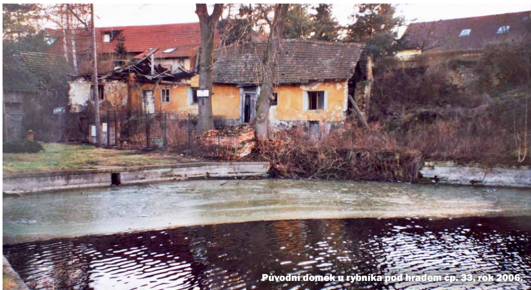
Původní domek u rybníka pod hradem čp. 33, rok 2006.

říku do prvního patra. Šnekovitě schodiště, které dále Heber objevil, bylo ve spodní části vylámané, ležela zde suť a byla propadlá střešní klenba. Povšiml si i nových domků kolem hradu, „které podstatně smazávají ráz hradu tak, že se o něm nedá říci nic jiného, než: byl pevný a krásný, ale velmi malý, takže jeho obyvatelé museli bydlet více nad sebou než vedle sebe, pokud chtěli získat prostor, který přináší trochu pohodlí,“ čímž Heber narážel na Meissnerova slova.